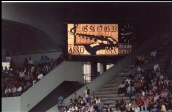
Levée de rideau d'un match de rugby devant 24 000 spectateurs