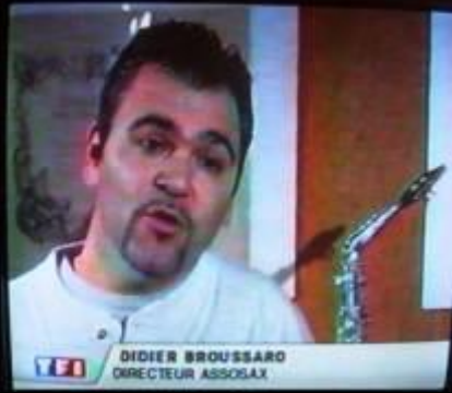
reportage sur Asso Sax au journal de 13h00