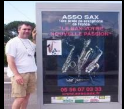
Campagne de pub réseau abri de bus